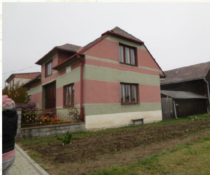
Ve skutečnosti v terénu stavba nová