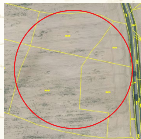
Sloučení parcel po revizi

stupci katastrálního úřadu snaží vlastníky s bydlištěm v místě konání revize osobně seznámit se zjištěnými nesoulady a projednat s nimi způsoby jejich odstranění. V případě, že se vlastníky zastihnout nepodaří, je zpravidla do jejich domovní schránky vložena pozvánka na projednání nesouladu s ná-