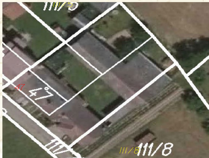
V katastru evidována původní stavba

Olga Kramářová, ředitelka KÚ pro Královéhradecký kraj, Katastrální pracoviště Trutnov