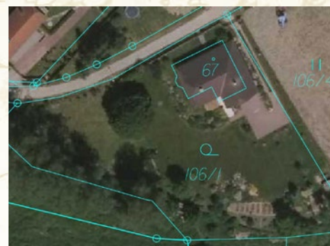
Sloučení parcel po revizi