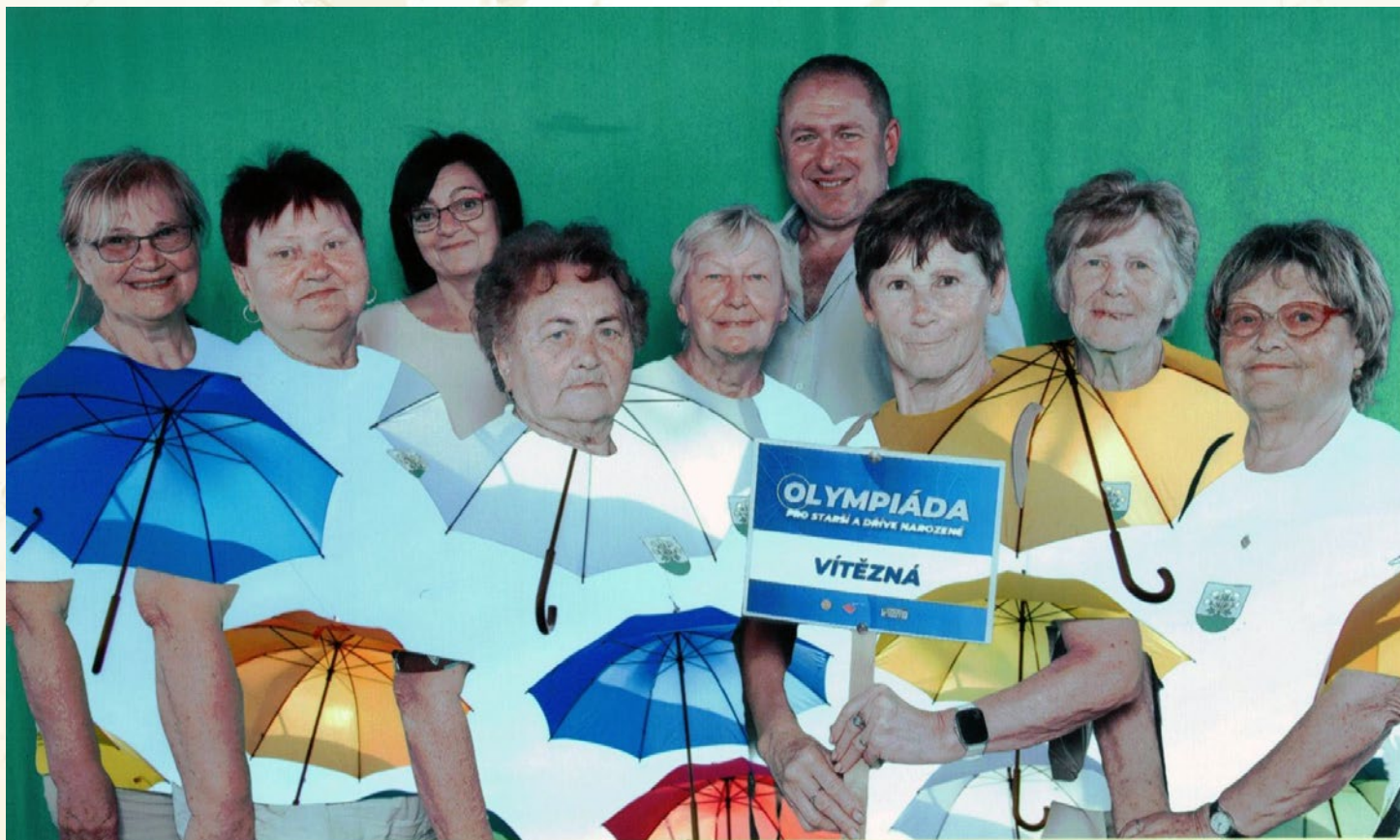
15. ročník Olympiády pro starší a dříve narozené, 7. 9. 2023